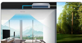
Voorzien van verse buitenluchtaansluiting