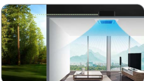
Voorzien van verse buitenluchtaansluiting